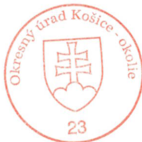
Ing. Gabriel Vukušič vedúci odboru

V zmysle § 8 ods. 6 zákona č. 330/1991 Zb. v znení neskorších predpisov proti tomuto rozhodnutiu nie je prípustný opravný prostriedok. Proti tomuto rozhodnutiu možno podať správnu žalobu v zmysle § 177 a nasl. §§-ov zákona č. 162/2015 Z. z. Správneho súdneho poriadku v znení neskorších predpisov, do dvoch mesiacov od oznámenia rozhodnutia.