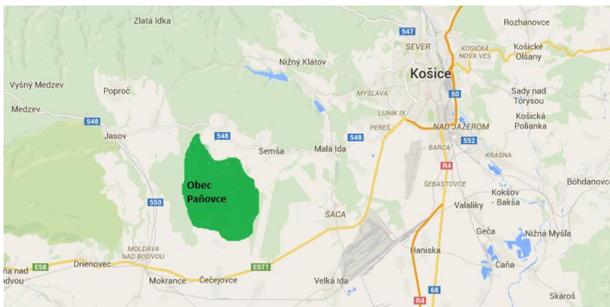
Obr. 1 – Situačné zobrazenia katastrálneho územia obce Paňovce

Obec sa nachádza 241 metrov nad morom, v JZ časti Košickej kotliny, 7,5 km na SV od Moldavy nad Bodvou. V súčasnosti má 588 obyvateľov. V obci je vybudovaný plynovod od roku 1989.